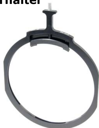
Filterhalter 410-38 für Rundfilter in einer 150mm Bühne.